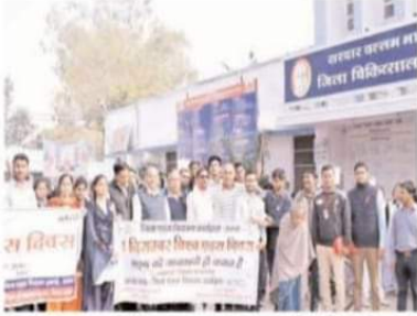
सतना, एमपीजेएस न्यून